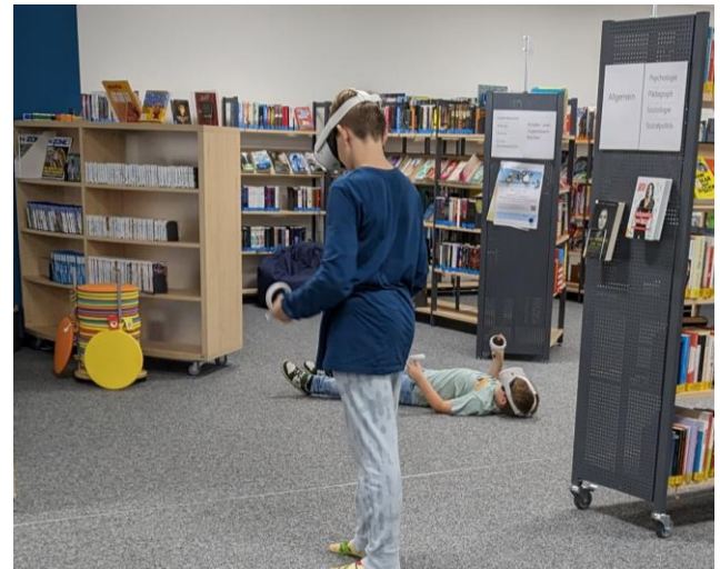
Gesamtkosten: 3.491,31 € / Fördersumme: 2.485,54€

Die Stadtbücherei Wahlstedt hat ihr digitales Angebot erweitert, indem sie einen Computer, VR-Brillen mit Zubehör und verschiedene Softwareprogramme erworben hat, um Kinder und Jugendliche am Stadtentwicklungskonzept zu beteiligen. Außerdem soll durch verschiedene Veranstaltungen motiviert werden, neue Technologien auszuprobieren und einfache Fähigkeiten wie Kommunikation und Geschicklichkeit zu erlernen.