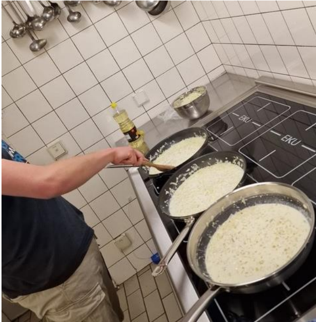
Gesamtkosten: 19.778,63 € / Fördersumme: 15.032,08 €