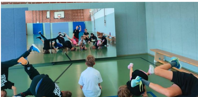
Gesamtkosten: 1.741,30 € / Fördersumme: 1.393,04 €

Der Verein Art2Spin Wahlstedt hat für das Breakdance- und HipHop-Training mit Kindern und Jugendlichen eine fahrbare Folien-Spiegelwand angeschafft, um die Trainingserfolge wie z. B. Körperbeherrschung zu verbessern.